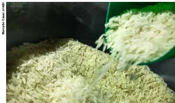
Os recursos para a compra pública de estoques de arroz serão viabilizados por meio da abertura de crédito extraordinário.

Informação foi dada pelo ministro da Agricultura, Carlos Fávaro. Trata-se de um dos efeitos das enchentes no Rio Grande do Sul, estado responsável por 70% da produção nacional de arroz.