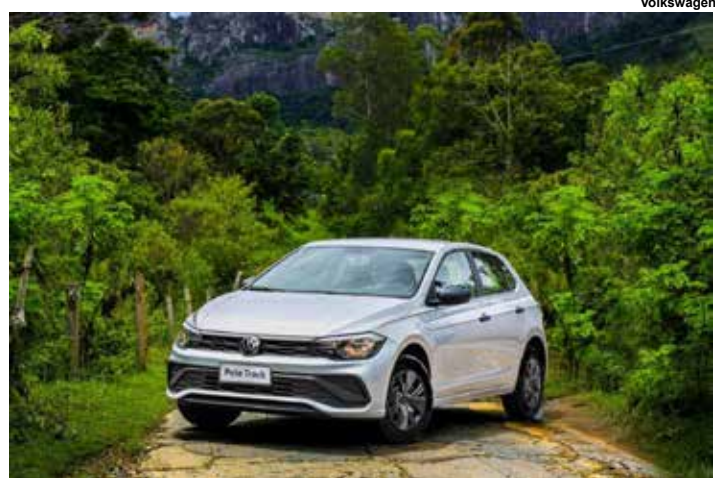
Polo continua líder do mercado.

Entre os dez, o Polo se mantém líder, com a Strada próxima, enquanto o T-Cross, às vésperas de uma atualização, é o líder dos SUVs. Confira!