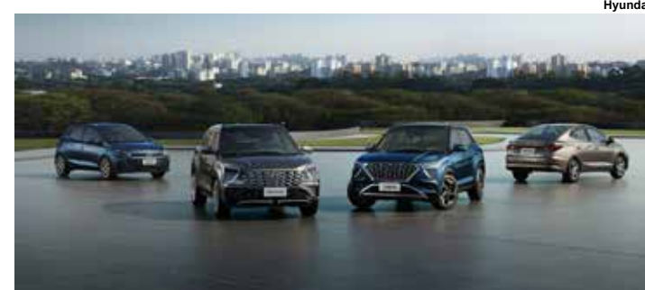
HB20 e CRETA nas versões 24_25.

Já para a opção de entrada, o HB20 Sense ganha chave tipo canivete, alarme perimétrico e rodas de 15”. As novidades do HB20 também se aplicam ao sedã. A diferença se dá na versão Comfort Plus MT, que recebe as novidades do hatch e ainda inclui ajuste de profundidade e altura do volante.