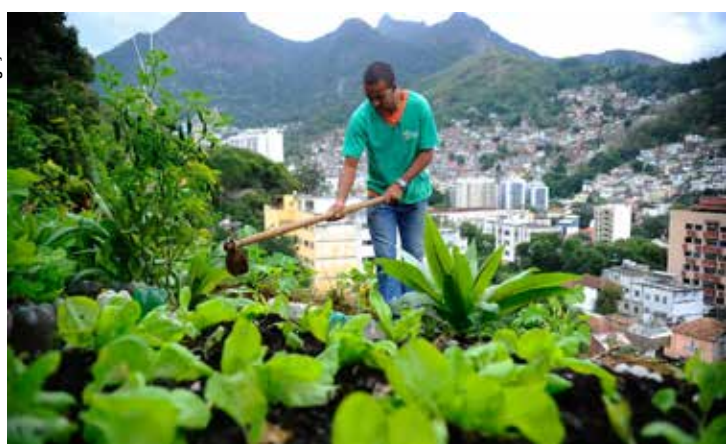
Quando o alimento é produzido perto dos consumidores, há potencial redução dos custos.

Esse é um dos alertas feitos por especialistas do Instituto Escolhas e da Cátedra Josué de Castro, da Faculdade de Saúde Pública da USP.