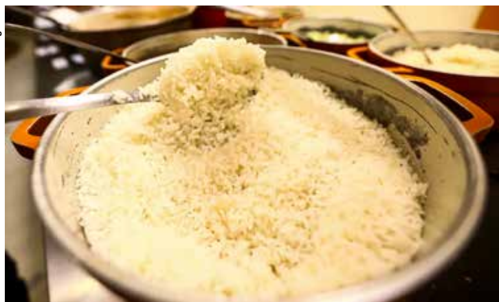
Mais de 20 milhões de brasileiros convivem com o problema, diz IBGE.

Os dados são da Pnad Contínua, divulgada pelo IBGE ontem (25). Esses mais de 7 milhões de lares que convivem com a redução na quantidade de alimentos consumidos ou com a ruptura em seus padrões de alimentação abrigam 20,6 milhões de pessoas.