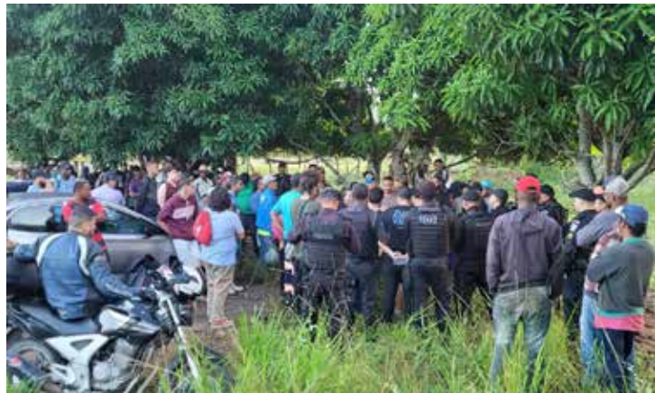
As regiões do país que concentraram mais conflitos foram o Norte e o Nordeste.

Embora ambos os números tenham registrado alta, na comparação com o ano anterior, a área em disputa foi reduzida em 26,8%, sendo agora de cerca de 59,4 mil hectares. Os dados são da última edição do relatório anual da Comissão Pastoral da Terra (CPT), divulgada ontem (22) em Brasília.