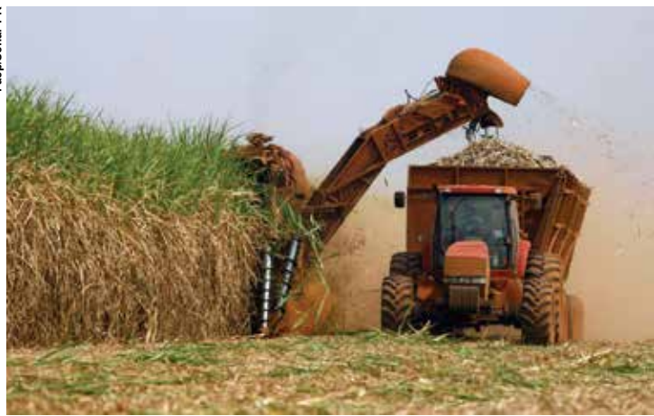
A produção brasileira de cana-de-açúcar estabelece novo recorde na série histórica acompanhada pela Conab.

O volume representa um aumento de 16,8%, quando comparado ao ciclo passado, como aponta o 4º Levantamento sobre a cultura divulgado, ontem (18). A área colhida registrou um leve crescimento de 0,5%, estimada em 8,33 milhões de hectares, enquanto o rendimento médio teve um incremento de 16,2%, saindo de 73.655 quilos por hectare para 85.580 kg/ha.