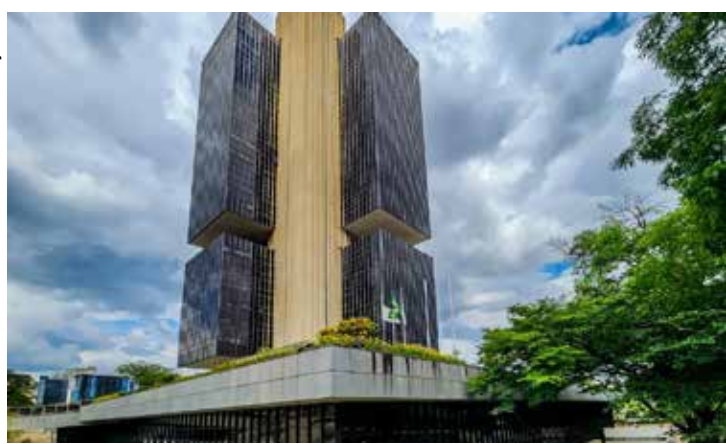
O comportamento dos preços fez o Banco Central (BC) cortar os juros pela sexta vez seguida.

De março de 2021 a agosto de 2022, o Copom elevou a Selic por 12 vezes consecutivas, num ciclo de aperto monetário que começou em meio a alta dos preços de alimentos, de energia e de combustíveis. Por um ano, de agosto de 2022 a agosto de 2023, a taxa foi mantida em 13,75% ao ano por sete vezes seguidas. Antes do início do ciclo de alta, a Selic tinha sido reduzida para 2% ao ano, no nível mais baixo da série histórica iniciada em 1986.