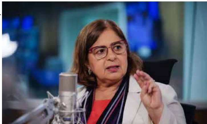
De acordo com a ministra das Mulheres, Cida Gonçalves, a proposta é incluir mulheres de 17 a 30 anos no mercado de trabalho.

De acordo com a ministra das Mulheres, Cida Gonçalves, a proposta é incluir mulheres de 17 a 30 anos, sobretudo negras e da periferia, no mercado de trabalho. O planejamento inclui a assinatura de um acordo de cooperação com o Sebrae para a qualificação dessas mulheres.