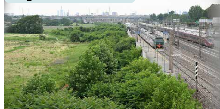
Área de San Donato Milanese onde deve ser construído o novo estádio do Milan.