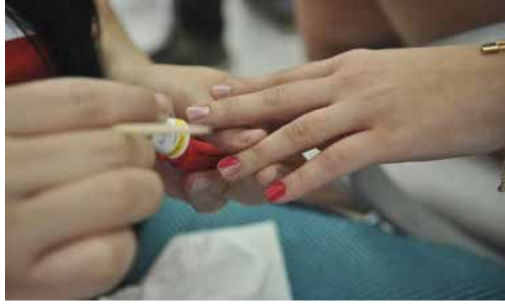
Os serviços prestados às famílias registraram alta de 4,7% e fecharam as atividades em expansão.

Acumulado nos dois últimos meses do ano representou avanço de 1,2%, o que permitiu a recuperação de parte da perda de 2,1% anotada entre agosto e outubro. Em relação a dezembro de 2022 os serviços apresentaram recuo de 2,0%, que é o mais intenso desde janeiro de 2021, quando houve queda de 5,0%.