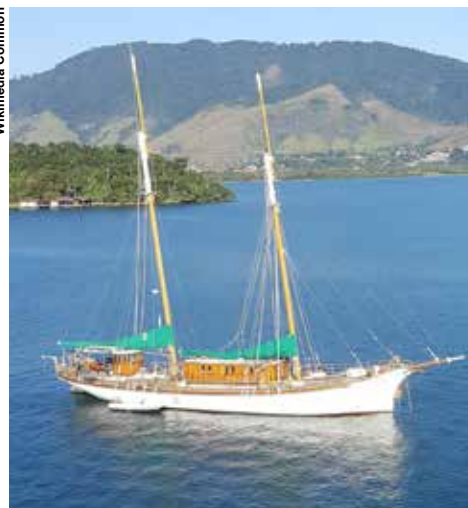
Veleiro 'Goleta Gringo' deve fazer travessia do Atlântico ainda neste ano.