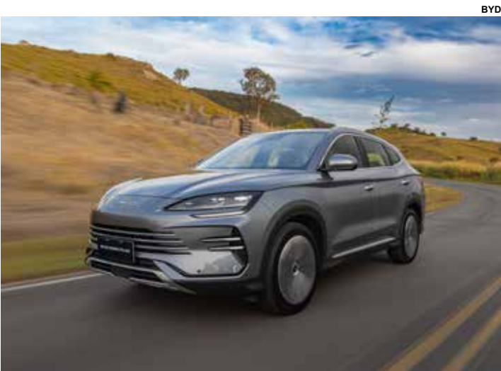
Song BYD mais vendido este ano.

Ainda assim, a Honda registrou crescimento de 19,2% e 65,5 mil emplacamentos até agosto, enquanto a Nissan, GM e Toyota tiveram as maiores quedas no acumulado do ano.