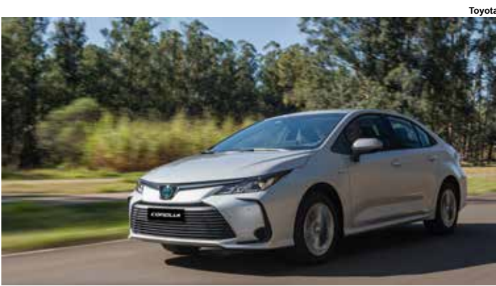
Corolla GLi Hybrid.

adaptativo, reconhecimento de faixa, ar-condicionado digital, câmera de ré, sensores, chave com partida por botão, bancos em tecido e couro, modos de condução (Eco, Sport, EV) e rodas de 16" entre outros itens.