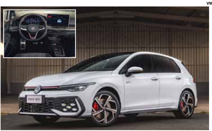
Novo Golf GTI.

Traz faróis e lanternas full led, teto solar panorâmico, painel digital de 10,9 polegadas e tela multimídia de 12,9 polegadas, entre outros itens.