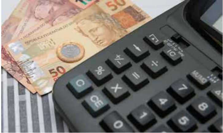
Com o resultado de agosto, o acumulado de 12 meses chega a 5,13%, ainda acima da meta do governo, de até 4,5%.

Com o resultado de agosto de 2025, o acumulado de 12 meses chega a 5,13%, abaixo dos 5,23% dos 12 meses terminados em julho, mas ainda acima da meta do governo, de até 4,5%. A conta de luz recuou 4,21% no mês, representando impacto negativo de 0,17 ponto percentual (p.p.), figurando como o subitem que mais puxou a inflação para baixo. Com isso, o grupo habitação recuou 0,90%. Esse recuo nesse conjunto de preços foi o maior para um mês de agosto desde o início do Plano Real, em 1994.