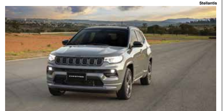
Jeep Compass 2026.

A Série S T270, com redução de R$ 15 mil, passou a custar R$ 236.990, incorporando novos itens de conforto e segurança, como ajuste elétrico dos bancos e teto solar panorâmico. A versão topo Blackhawk ficou R$ 16.500 mais acessível, por R$ 279.990, com melhorias como rodas esportivas, freios vermelhos e seletor de terrenos, além do motor Hurricane de 272 cv. 7.