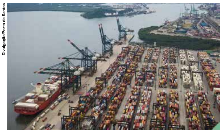
Cerca de 700 produtos do Brasil ficaram fora do tarifaço.

A medida, assinada na semana passada pelo presidente norte-americano Donald Trump, afeta 35,9% das mercadorias enviadas ao mercado estadunidense, o que representa 4% das exportações brasileiras. Cerca de 700 produtos do Brasil ficaram fora do tarifaço.