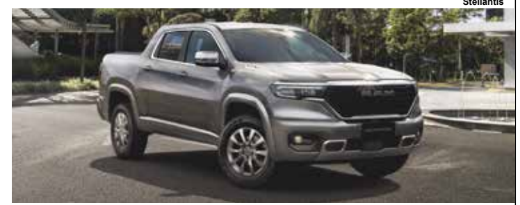
Rampage Big Horn 2026.