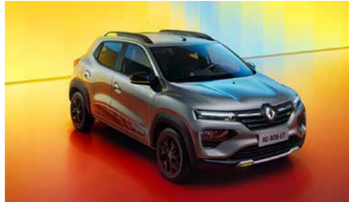
Renault Kwid Outsider.

Fiat Argo teve crescimento de 37,7%, Fiat Mobi (27,6%), Chevrolet Onix (13,4%), Volkswagen Polo (12,6%). Já Hyundai HB20 recuou -20,2% e o Renault Kwid, -30%.