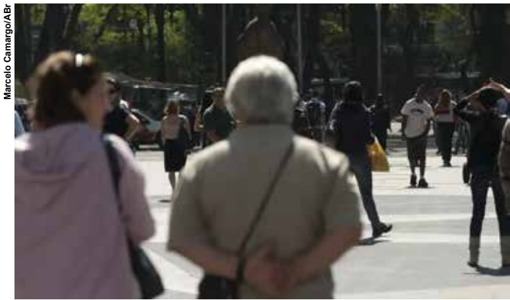
Ao todo, 533 mil beneficiários serão contemplados ainda nesta semana.

Segundo o INSS, mais de um milhão de pessoas (1.052.128) já formalizaram o pedido de ressarcimento. Para reforçar a comunicação com quem ainda não aderiu ao acordo, os bancos que pagam os benefícios também começaram a avisar os