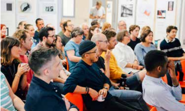
Al/CreativeMornings São Paulo