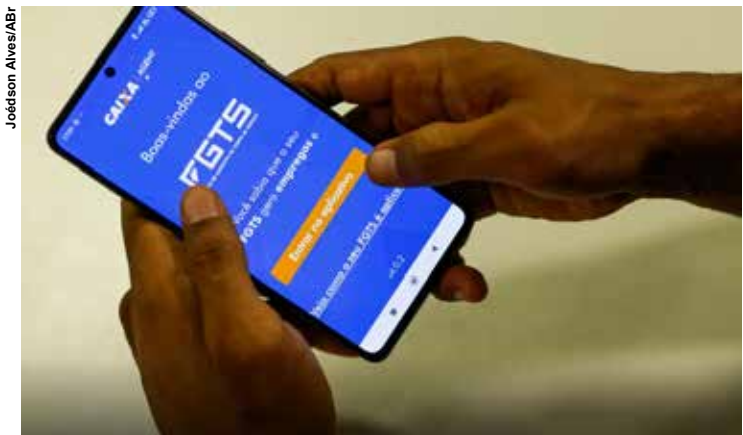
Valores acima de R$ 3 mil serão pagos a trabalhadores demitidos.

Cerca de 8,1 milhões de trabalhadores que aderiram ao saque-aniversário do Fundo de Garantia do Tempo de Serviço (FGTS) e foram demitidos sem justa causa de janeiro de 2020 até o fim de fevereiro deste ano começaram a receber o saldo acima de R$ 3 mil dos depósitos dos antigos empregadores. Ao todo, a Caixa Econômica Federal liberará R$ 6,4 bilhões nesta rodada.