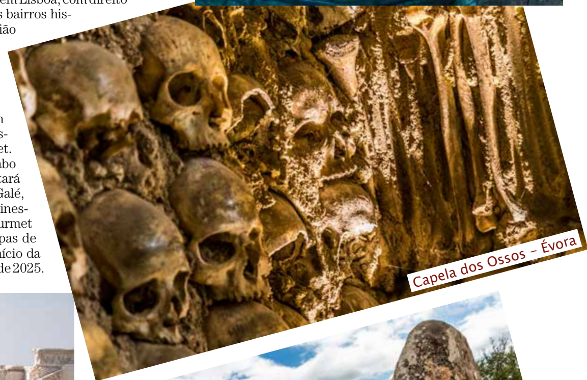
Capela dos Ossos – Évora