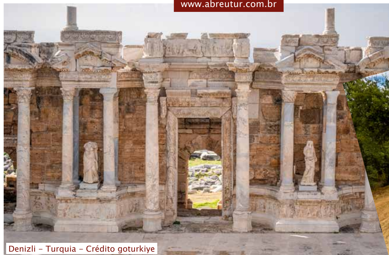
Denizli – Turquia