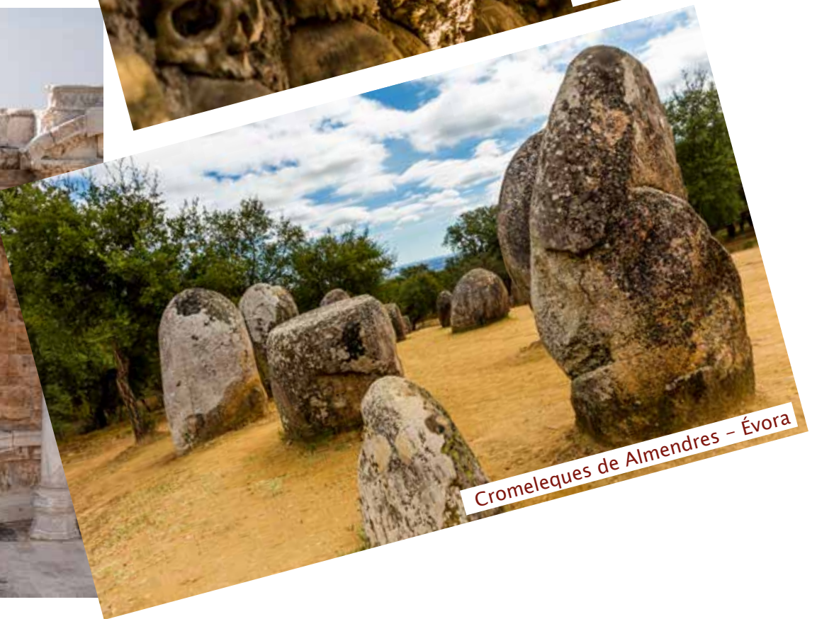
Cromleques de Almendres – Évora