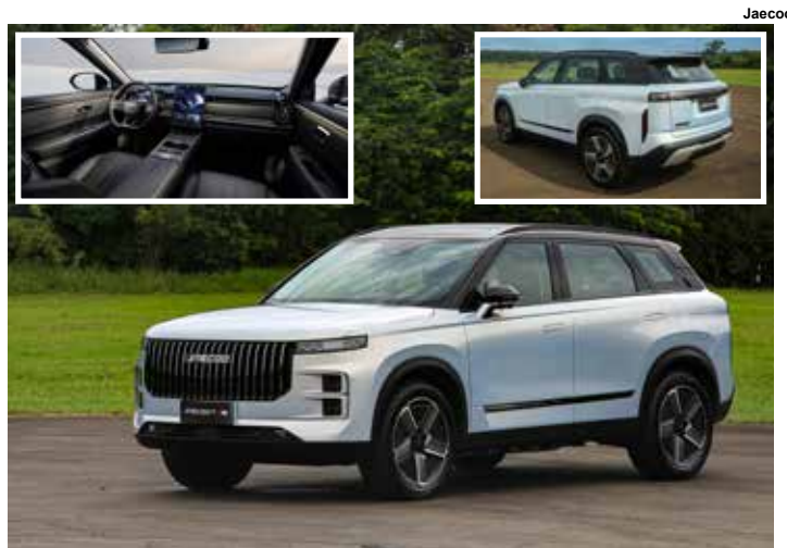
Jaecoo 7 SHS.

Com 4,5 metros de comprimento, o Jaecoo 7 possui um design imponente, destacando-se pela ampla grade frontal e lanternas traseiras finas. Internamente, oferece um ambiente minimalista com bancos em material sintético premium, ar-condicionado de duas zonas e um sistema de infotainment com tela de 14,8".