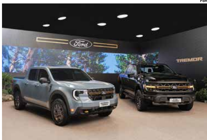
Ford Maverick e F-150 Tremor.

Preços e outras informações serão divulgados próximo ao lançamento.