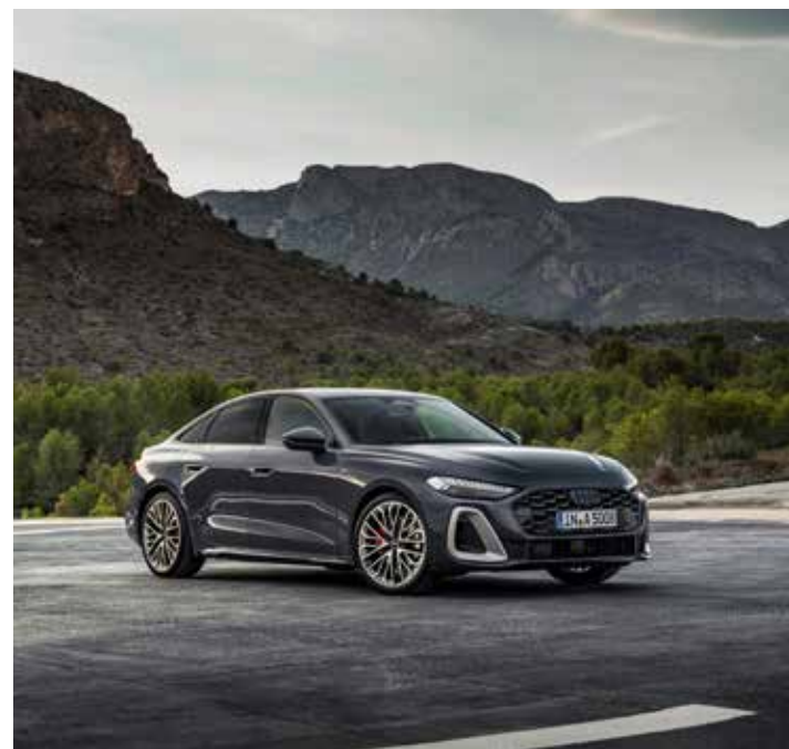
Novo Audi A5.

Informações sobre detalhes técnicos, versões e preço ainda não foram divulgadas.