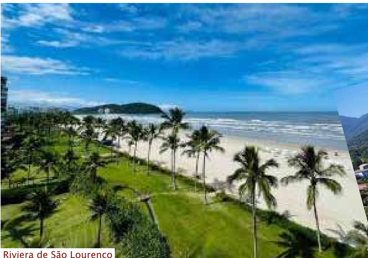
Riviera de São Lourenço