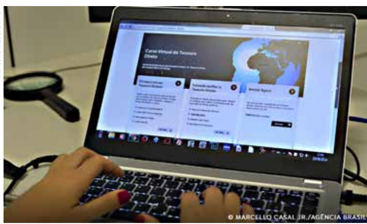
Programa distribui R$ 5,2 milhões a 40 negócios de impacto social.

Uma plataforma de soluções financeiras a trabalhadores informais, um negócio que oferece recompensas a quem recicla o lixo, uma ferramenta automática de tradução de linguagem de sinais são alguns dos 40 negócios de impacto, empresas com foco em questões sociais e ambientais, que receberão apoio financeiro do Tesouro Direto e da B3. Os nomes foram anunciados na sede da B3, em São Paulo.