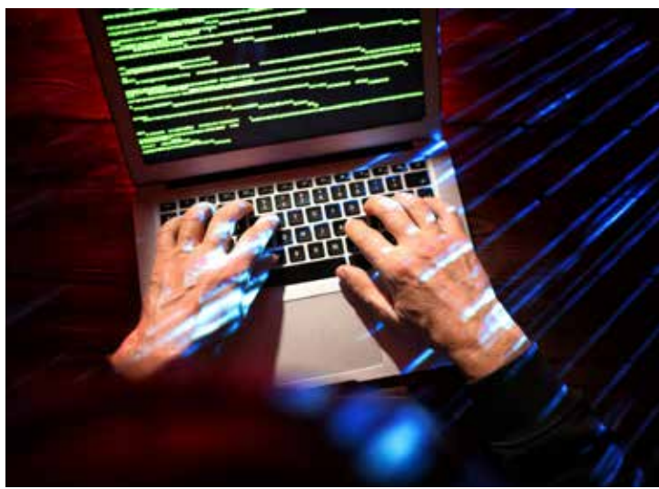
PIRELLA GÖTTSCHE LOWE

Esses índices revelam aquilo que todos já sentem ao buscar algum produto ou serviço na internet. Já é difícil distinguir se determinada marca é verdadeira, se aquele é o seu site oficial ou se o conteúdo que se diz ter