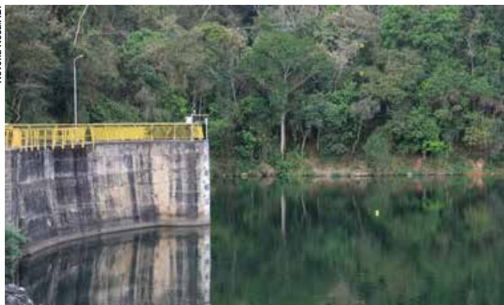
Segundo a Agência Nacional de Águas, a temporada de estiagem teve seu pior momento entre julho e agosto, atingindo 95% do estado.

Em setembro de 2022 os paulistas viram 100% de seu território atingido pelo fenômeno, sendo 21% classificado pela agência como