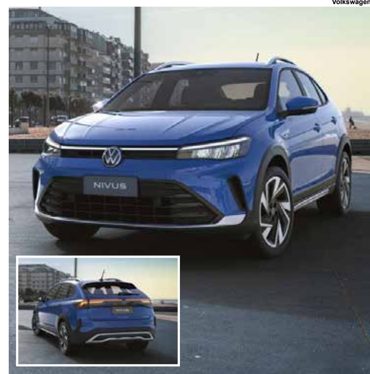
Novo Nivus 2025.

As três primeiras revisões são gratuitas. Uma versão GTS de 150 cv chega no início de 2025.