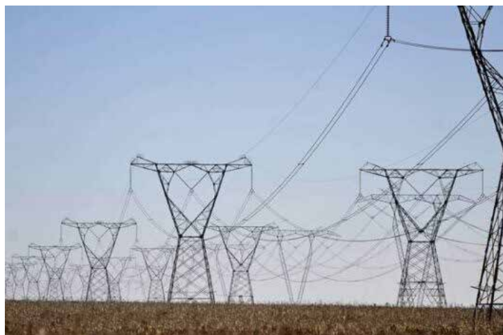
Entre as diretrizes previstas estão a maior inserção de energias renováveis no setor elétrico.

jeção para o setor é de 558 milhões de toneladas de CO 2 e, ainda considerando os compromissos assumidos pelo poder público e os planos estratégicos de empresas do setor. Segundo a coordenadora de políticas