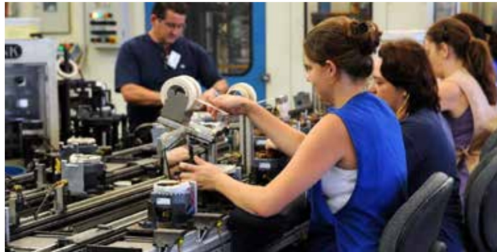
Em 2024, o país reduziu a desigualdade em comparação a anos anteriores, mas ainda mantém a maioria das vagas ocupadas por homens.

Enquanto o saldo dos empregos formais para homens cresceu 10,1% entre janeiro e agosto, em comparação com o mesmo período de 2023, o saldo para as mulheres aumentou 45,18%. Esse crescimento contribuiu para uma redução da desigualdade no mercado de trabalho.