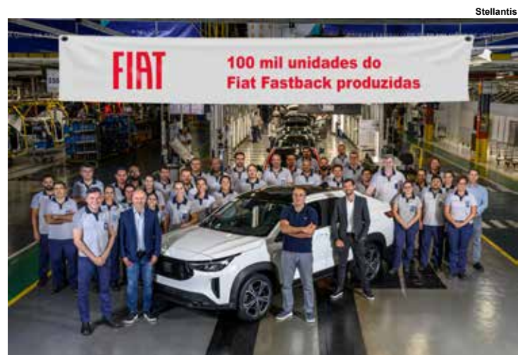
Fiat Fastback 100 mil.

Toda a linha do Fastback é equipada com motores turbo T200 e T270. “O Fastback é o melhor exemplo do atual momento da Fiat no Brasil. Ganhador de diversos prêmios o modelo já é um case de sucesso da marca e atingir a marca de 100 mil unidades produzidas é um grande marco que reflete a aceitação do público e a força do modelo”, destacou Alexandre Aquino, vice-presidente da Fiat para a América do Sul.