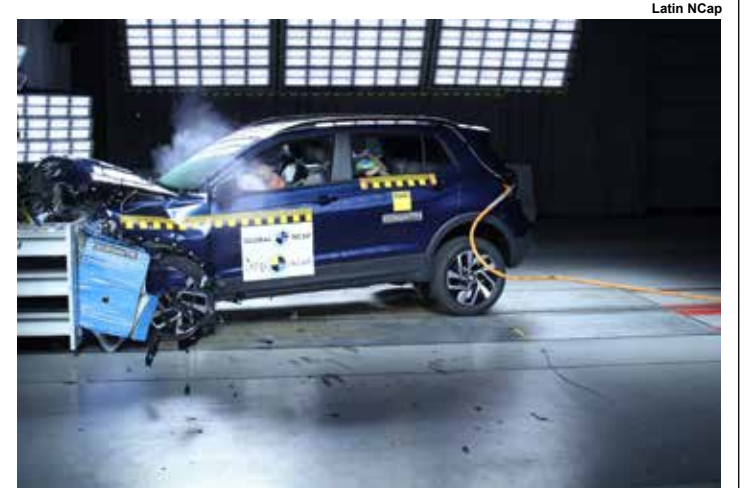
Crash test VW T-Cross.

A proteção de pedestres apresentou proteção adequada a boa para a cabeça na maioria das áreas, proteção adequada para a parte inferior da perna e proteção fraca a ruim para a parte superior da perna.