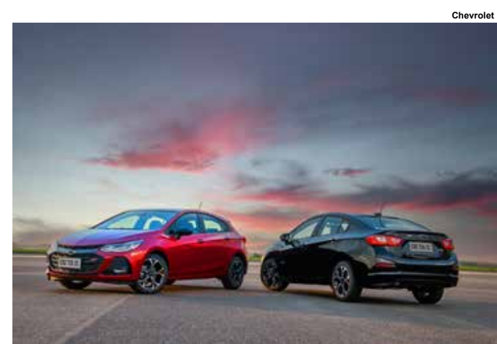
Cruze Hatch e Sedan.

O hatch como produto é bom, mas já é um modelo que desvaloriza mais.