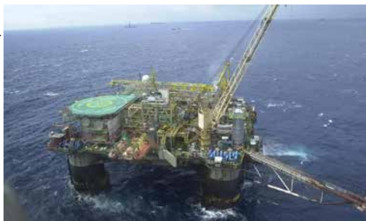
A influência positiva mais importante veio das indústrias extrativas, notadamente petróleo, gás natural e minério de ferro, com alta de 1,1%.

Com os resultados apresentados, a indústria brasileira se encontra 1,5% acima do patamar pré-pandemia, de fevereiro de 2020. No entanto, se posiciona ainda 15,4% abaixo do nível mais alto já registrado, em maio de 2011. Apesar da produção industrial ter ficado no campo positivo na passagem de julho para agosto, o detalhamento da pesquisa revela que houve recuo em 18 dos 25 ramos industriais pesquisados.