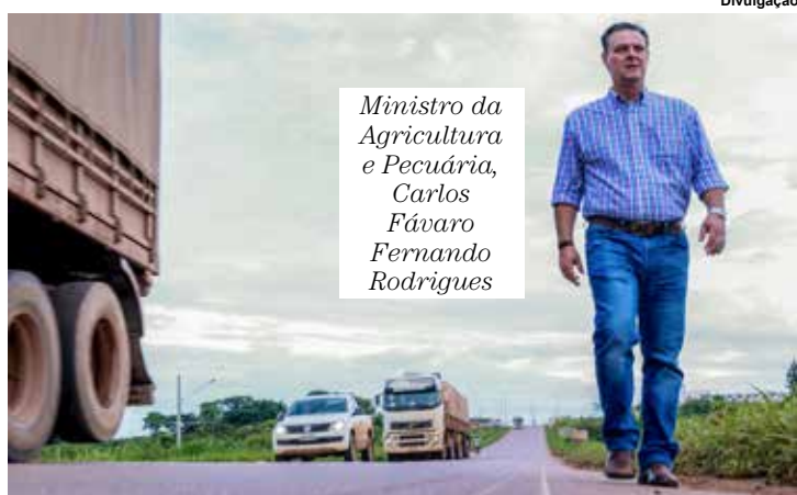
Ministro da Agricultura e Pecuária, Carlos Fávaro Fernando Rodrigues

A importância da abertura de novos mercados para o agronegócio brasileiro é o tema da palestra "Voz Para o Mundo: 200 Novos Mercados Abertos", que o ministro da Agricultura e Pecuária, Carlos Fávaro, vai proferir durante o 9º Congresso Nacional das Mulheres do Agronegócio (CNMA), que será realizado nos dias 23 e 24 de outubro, no Transamerica Expo Center em São Paulo (SP).