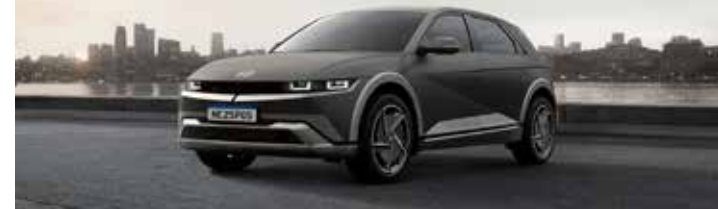
CHYUNDAI IONIQ 5.

(*) - É economista e jornalista especializada no setor automotivo, editora do portal www.viadigital.com.br e do canal @viadigitalmotors no YouTube. E-mail: lucia@viadigital.com.br