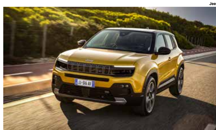
Jeep Avenger, futuro brasileiro.

Trata-se do Jeep Avenger, que usará a mesma plataforma CMP da Citroën, com o sistema micro-híbrido Bio-Hybrid. Ele é menor que o Renegade e por isso será o modelo de entrada da Jeep no Brasil.