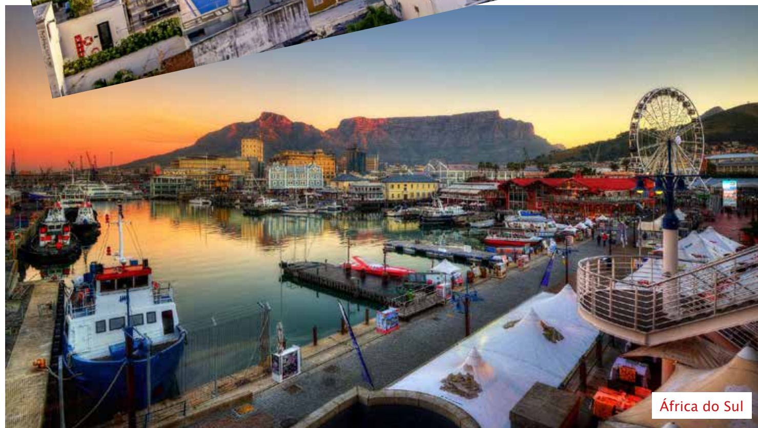
África do Sul