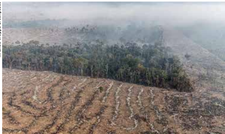
A agropecuária, a mineração e o setor madeireiro são as principais atividades que contribuem para o desmatamento da Amazônia.