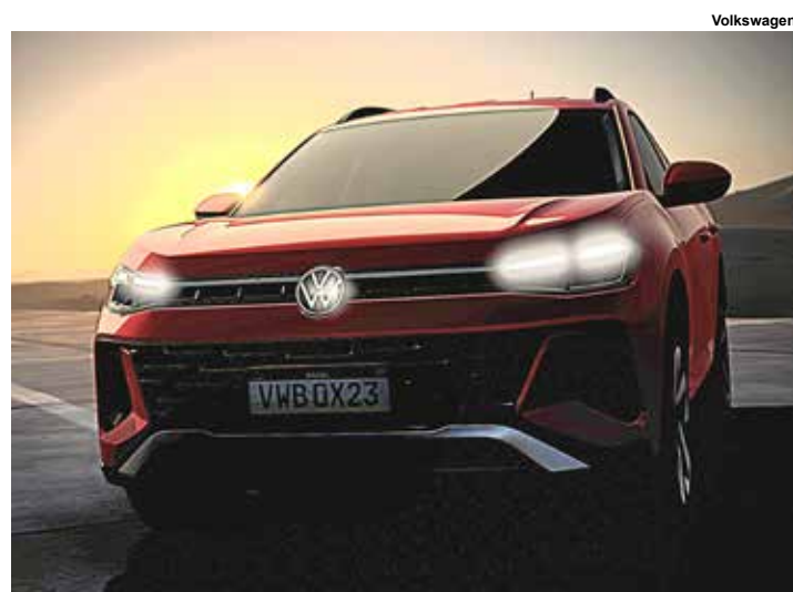
Novo SUV 2025.

O novo Volks será seu SUV de entrada e ficará posicionado abaixo do Nivus e do T-Cross. No festival carioca, o carro está exposto, mas de forma velada: dentro de uma caixa só é possível ver sua silhueta. A foto divulgada pela marca, após edição, entrega mais de seus detalhes frontais como grade, faróis e rodas.