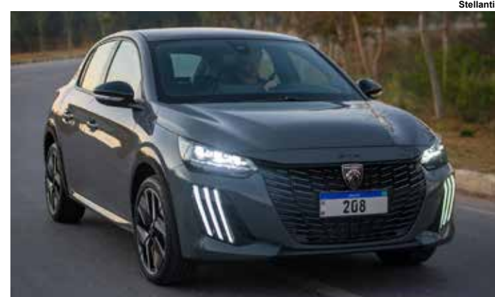
Novo Peugeot 208.

Os preços partem de R$ 77 mil (R$ 1 mil a mais que o do anterior), na versão Active 1.0 MT; R$ 89 mil Style 1.0 MT; R$ 98.990 Allure Turbo 200 CVT e a nova GT Turbo 200 CVT por R$ 114.990.