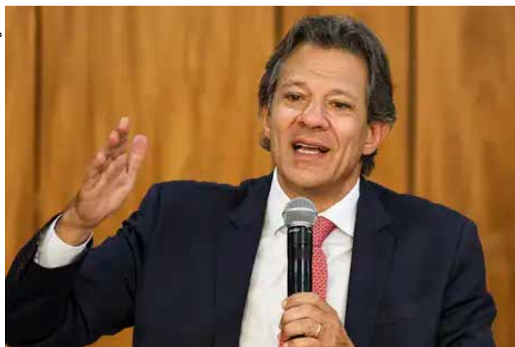
Exportação pode ser "carro-chefe" do bom ciclo econômico que o Brasil vive, diz o ministro da Fazenda, Fernando Haddad.

O acordo com o Sebrae visa incentivar cooperativas, micro e pequenas empresas (MPE), especialmente das regiões Norte e Nordeste, a iniciar ou aperfeiçoar estratégias voltadas para a exportação. Serão aproximadamente R$ 175 milhões para o desenvolvimento de novos produtos e metodologias para suprir lacunas na jornada do empreendedor que quer exportar, ações alinhadas à Política Nacional da Cultura Exportadora.