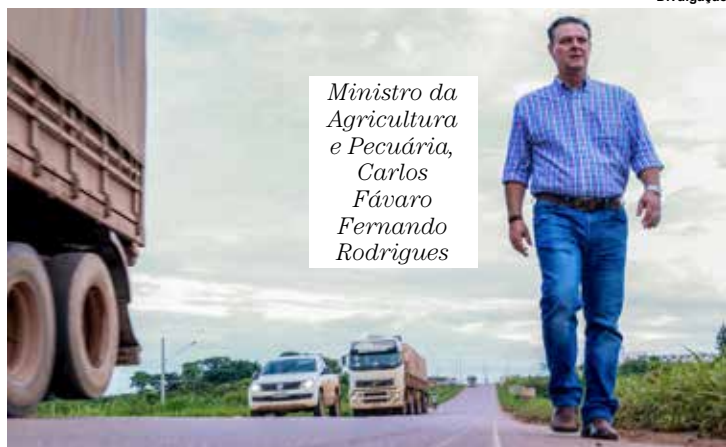
Ministro da Agricultura e Pecuária, Carlos Fávaro Fernando Rodrigues

A importância da abertura de novos mercados para o agronegócio brasileiro é o tema da palestra "Voz Para o Mundo: 200 Novos Mercados Abertos", que o ministro da Agricultura e Pecuária, Carlos Fávaro, vai proferir durante o 9º Congresso Nacional das Mulheres do Agronegócio (CNMA), que será realizado nos dias 23 e 24 de outubro, no Transamerica Expo Center em São Paulo (SP).