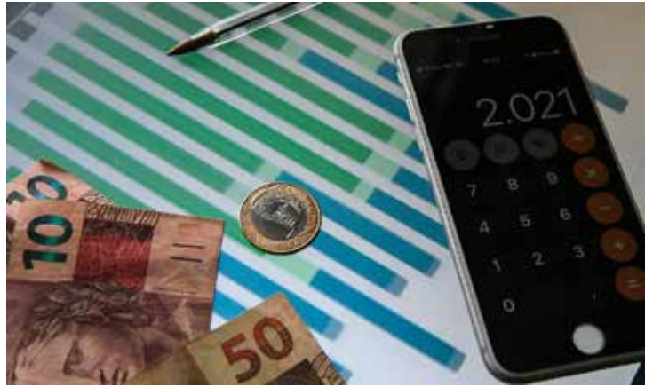
De acordo com o IBGE, na comparação com o segundo trimestre de 2023, a alta foi de 3,3%.

A estimativa está no Boletim Focus de ontem (16). A revisão de 0,28 ponto percentual para cima ocorre após a divulgação do PIB do segundo trimestre, que surpreendeu e subiu 1,4% em comparação ao primeiro trimestre. De acordo com o IBGE, na comparação com o segundo trimestre de 2023, a alta foi de 3,3%.