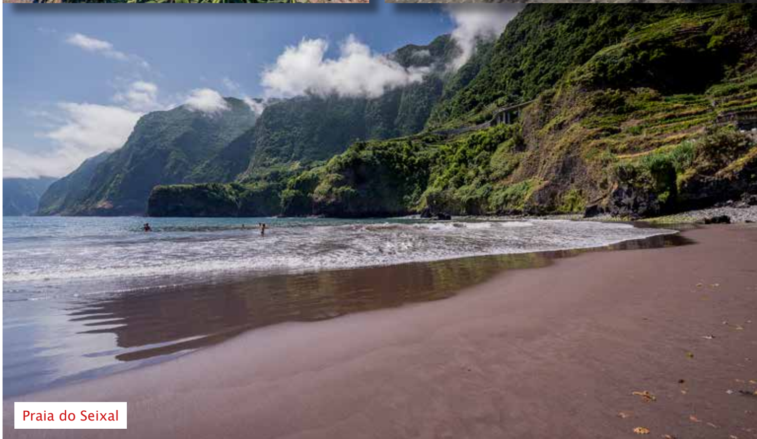
Praia do Seixal