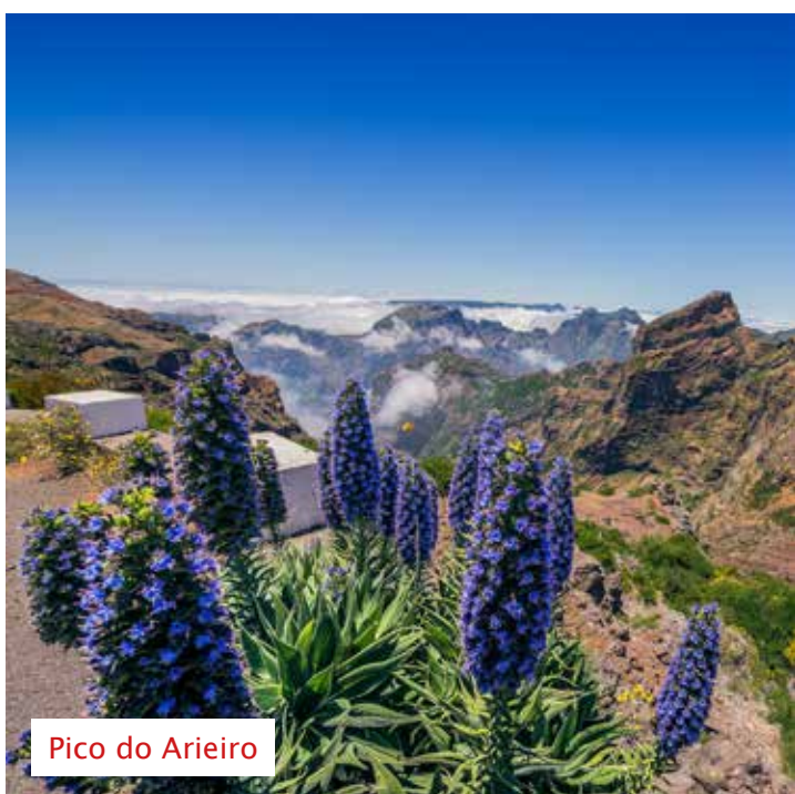
Pico do Arieiro

Localizado em Funchal, o famoso Jardim Botânico é outro lugar imperdível para quem deseja apreciar paisagens naturais incríveis. O verde do jardim se une ao azul do Oceano Atlântico, formando visuais realmente impressionantes. O local é conhecido por sua imensa biodiversidade de plantas exóticas de vários lugares do mundo. Fundado em 1960, o Jardim Botânico oferece aos visitantes uma experiência imersiva na rica biodiversidade da ilha.