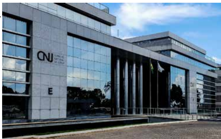
Aprovação por unanimidade evita abertura de ação judicial.

Com a medida agora aprovada pelo CNJ, basta que haja consenso entre os herdeiros para que a partilha extrajudicial possa ser registrada em cartório. No caso de menores incapazes, a resolução sobre o assunto determina que o procedimento extrajudicial pode ser feito desde que lhe seja garantida a parte ideal de cada bem ao qual o incapaz tiver di-