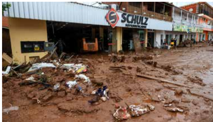
Mais de 80% dos recursos aprovados foram para pequenas e médias empresas.

Ao todo, foram aprovados R$ 4,8 bilhões até 5 de agosto, em mais de 2.680 operações. Mais de 80% dos recursos aprovados foram para pequenas e médias empresas. O Programa atende empresas e empreendedores de áreas afetadas pelos eventos climáticos extremos, desde que tenham sofrido perdas materiais decorrentes da tragédia.