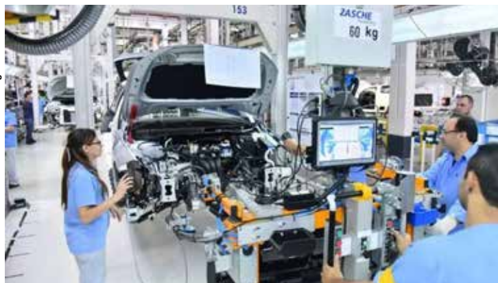
Com os últimos resultados, a indústria gaúcha está 2,7% acima do patamar pré-pandemia, semelhante ao da indústria nacional de 2,8%.

Retomada da produção nas fábricas gaúchas em junho, mês seguinte às enchentes que inundaram grande parte do Rio Grande do Sul, fez com que a produção industrial no estado tivesse um crescimento de 34,9%, de acordo com a Pesquisa Industrial Mensal Regional, divulgada ontem (8) pelo IBGE. A expansão é a maior já registrada pelo estado na série histórica da pesquisa.