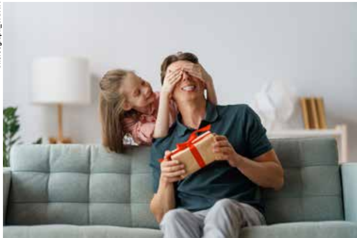
Cherograph - CANVA

Dados da CNC (Confederação Nacional do Comércio) projetam que somente as marcas de vestuário devem alcançar receita de mais de R$ 3 bilhões com o Dia dos Pais neste ano, seguidas pelo ramo de perfumaria e cosméticos, com expectativa de R$ 1,5 bilhão.