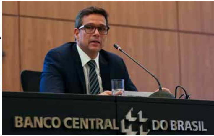
O presidente do Banco Central, Roberto Campos Neto.

Em junho, influenciada principalmente pelo grupo de alimentação e bebidas, a inflação do país foi 0,21%, após ter registrado 0,46% em maio. De acordo com o IBGE, em 12 meses, o IPCA acumula 4,23%. Para o mer-