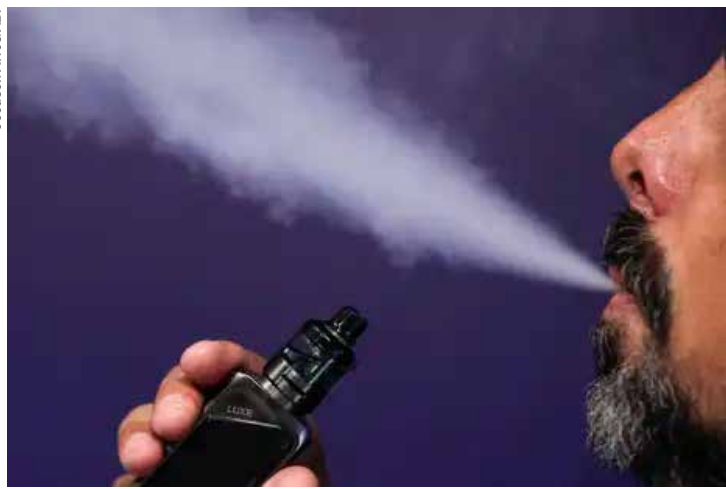
Cigarro eletrônico também conhecido como "vape".

As estimativas de câncer de traqueia, brônquio e pulmão para o triênio de 2023 a 2025 são de 32.560 novos casos por ano, de acordo com o Instituto Nacional de Câncer (Inca). Somente no estado do Rio de Janeiro, o número estimado de casos de tumores de traqueia, brônquios e pulmão, para cada ano do triênio 2023-2025, é de três mil novos pacientes, sendo 1.550 entre os homens e 1.450 entre as mulheres.