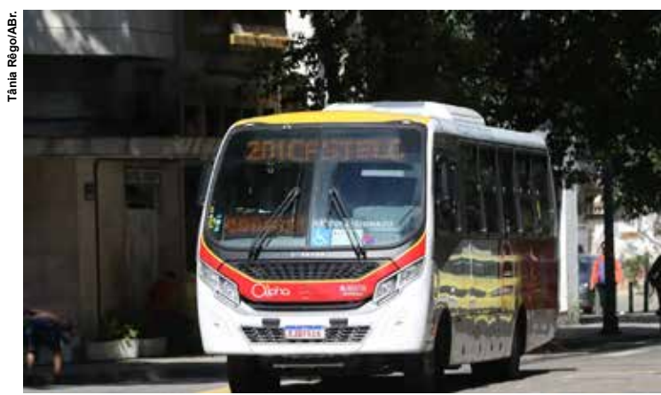
A maior variação, de 1,12%, e o maior impacto, de 0,23 ponto percentual, partiram do grupo Transportes.

O IPCA-15, divulgado ontem (25) pelo IBGE, mostrou que a maior variação, de 1,12%, e o maior impacto, de 0,23 ponto percentual, partiram do grupo Transportes, seguidos por Habitação (0,49% e 0,07 p.p.) e Saúde e Cuidados Pessoais (0,33% e 0,05 p.p.). Em 12 meses, a variação do IPCA-15 atingiu 4,45%, patamar superior aos 4,06% verificados em igual período imediatamente anterior.