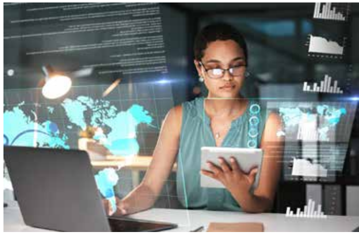
Proplimgaga.com - Yurifacura, CANVA

Ao integrar essas operações em uma única plataforma, a empresa tem uma maior conveniência na realização de