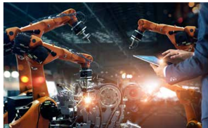
Pop Nukoonrat's Images_CAIWA

Eficiência e competitividade - As capacidades