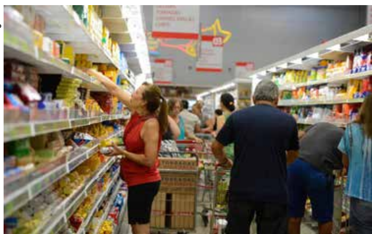
Mesmo com o desaquecimento do mercado de trabalho, ainda há boas perspectivas para a venda de bens duráveis.

Esse é o primeiro resultado negativo desde o começo do ano da ICF, apurada mensalmente pela Confederação Nacional do Comércio (CNC). Na análise anual, o crescimento foi de 2,3%, a menor taxa desde junho de 2021. Ainda assim, a ICF permanece na zona de satisfação, aos 101,5 pontos. A satisfação com a renda atual aumentou 0,2%.