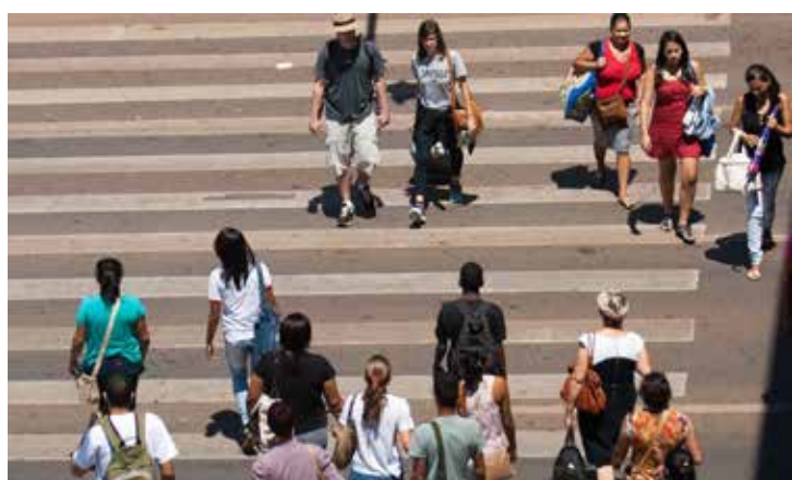
A pressão dos preços de algumas categorias de produtos e de serviços, refreia a expansão do otimismo.

O contingente que acha que o país está igual ao ano passado é de 31%, um ponto a mais que no levantamento anterior. Realizada entre os dias 28 de junho a 4 de julho, com 2 mil pessoas nas cinco regiões do país, pelo Ipespe, o Radar Febraban mapeia a percepção e expectativa da sociedade sobre a vida, aspectos da economia e prioridades para o país.