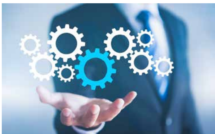
Uma equipe bem estruturada deve funcionar sem a presença instrutiva da gestão.

Logo pensamos na TI, mas que geralmente está ajudando em projetos que envolvem demandas de clientes, o que torna muito difícil entrar na fila de priorização. Para sair dessa, ganhar autonomia para automatizar os fluxos da equipe e organizar a conexão entre departamentos, prazos e tarefas, muitos gestores