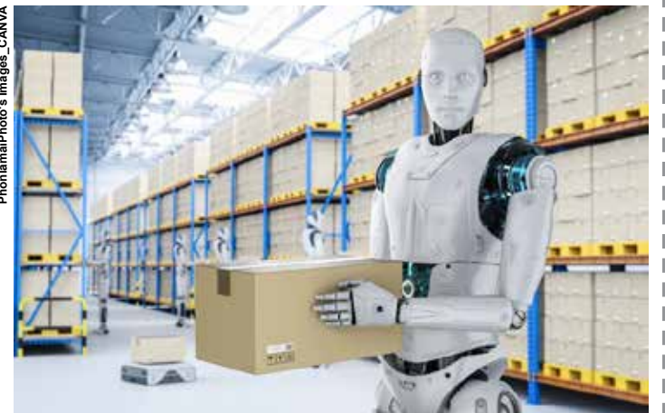
Hoje em dia, sem tecnologia, o embarcador vai perder dinheiro.

Outro tipo de simulação é a automática, que avalia o melhor cenário para o embarque antes mesmo da contratação do transportador ou da emissão da nota. Neste