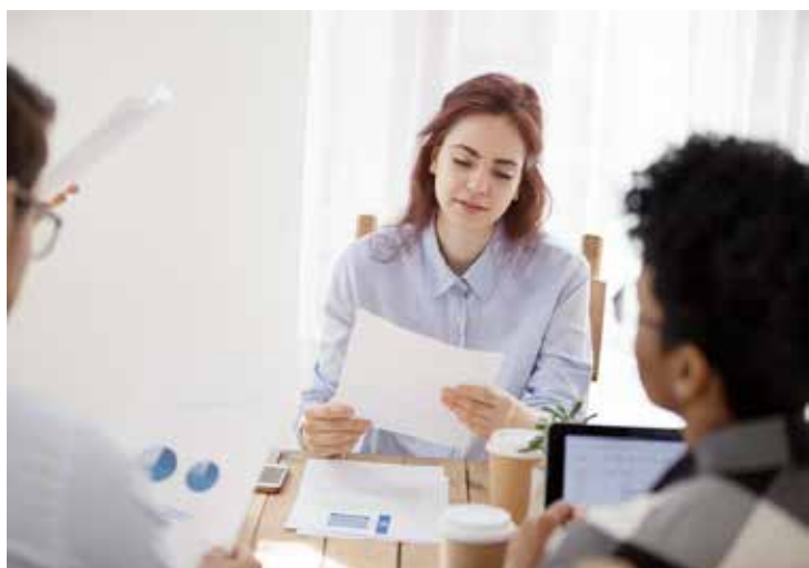
Tarefas com alto teor de complexidade são desempenhadas de forma manual, estando ainda mais suscetíveis a erros.