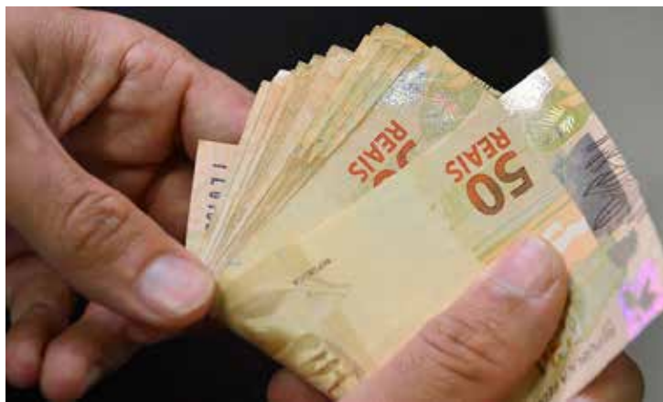
Recursos são do Programa Nome Limpo, do governo de São Paulo.

O valor pode variar de R$ 100 a R$ 5 mil com até 180