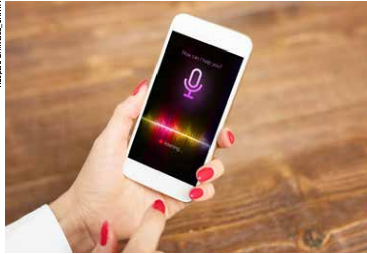
Disponibilizar esse recurso será um diferencial aos olhos do consumidor em um futuro breve.

Se deixarmos a imaginação ir longe, podemos prever, por exemplo, pessoas fazendo compras com rapidez a partir do painel do carro, enquanto voltam para casa, unicamente usando a voz”, prevê