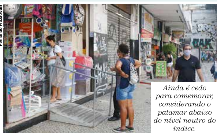
Ainda é cedo para comemorar, considerando o patamar abaixo do nível neutro do índice.

A inflação elevada, renda média do trabalhador em baixa, confiança dos consumidores em queda e juros em alta parecem ser fatores que pressionaram a confiança do comércio nesse nível mais baixo. Para voltar ao caminho de recuperação da confiança serão precisos sinais positivos nos fatores mencionados, além da continuidade do