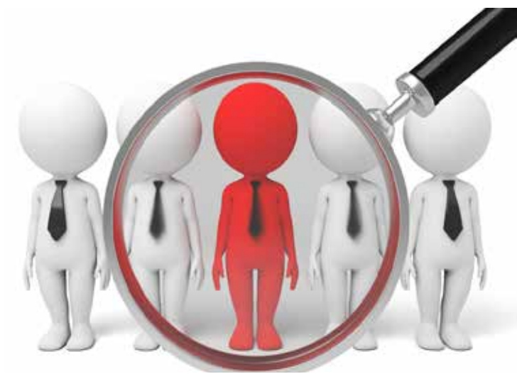
Com o avanço do trabalho remoto, é possível ter um emprego internacional até mesmo sem sair do Brasil.

“Por mais que a competição por esses profissionais seja difícil, é possível reverter a situação com mudanças de comportamento por parte da empresa. A saída para reter esses talentos passa por uma ótima cul-