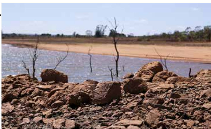
Os efeitos da estiagem na Região Sul vêm se agravando, causando prejuízos econômicos e ameaçando o abastecimento hídrico.

Uma das regiões gaúchas mais castigadas pela falta de chuvas é a do Alto da Serra do Botucará, onde, desde meados de novembro, o volume de chuvas é insuficiente para recuperar a condição dos rios e do sistema freático. “A soja teve que ser replantada e ainda ficou uns 30% a 35% por semear. Então, nesses 16 municípios, só na soja se chega a algo em torno de R$ 750 milhões de perdas. Somadas às perdas do milho e leite, o prejuízo, na região