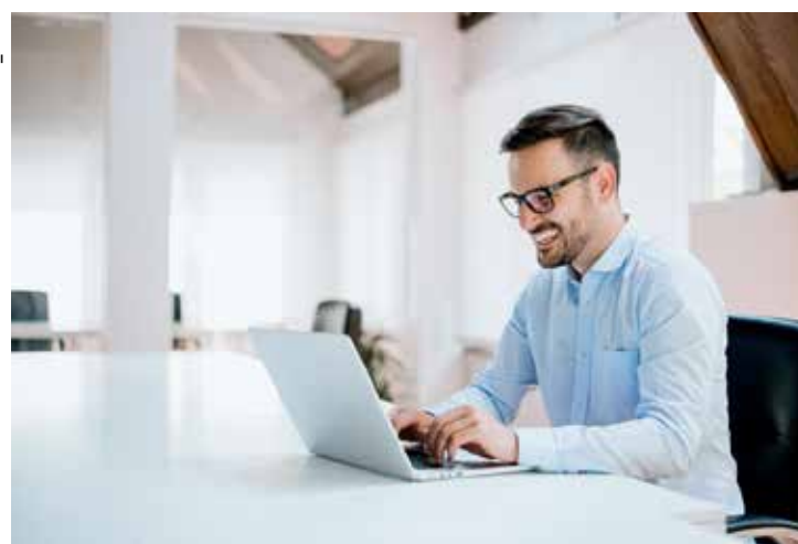
É importante avaliar objetivos e metas diante dos aspectos internos, como ações de marketing digital.