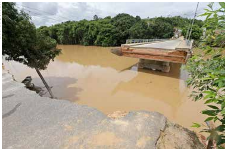
O dinheiro será usado para recuperar estradas das regiões Nordeste, Norte e Sudeste atingidas pelas fortes chuvas dos últimos dias.

A liberação dos recursos já está acertada com o Ministério da Economia. No fim de dezembro, o governo federal já havia liberado R$ 200 milhões para a recuperação de rodovias em diversos estados, principalmente Bahia e Minas Gerais, que registram, até agora, a maior extensão de estradas danificadas. Além do recurso para rodovias, Bolsonaro disse