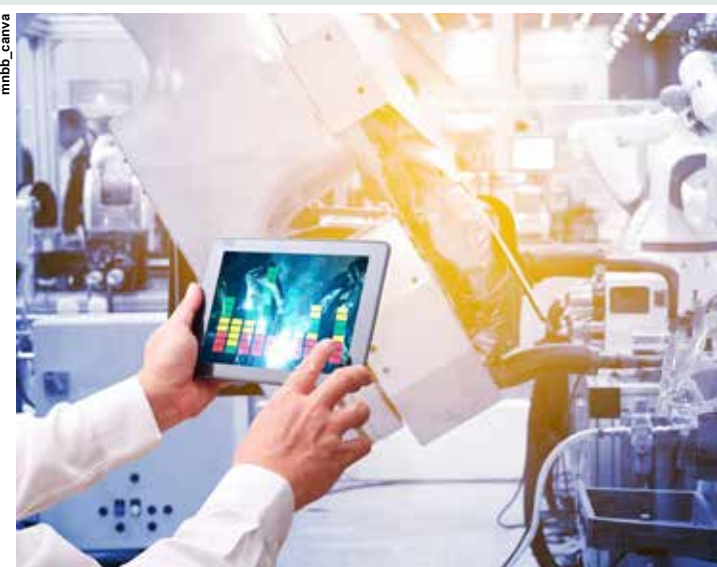
É fundamental implementar plataformas e rotinas de gestão e produção baseadas na Indústria 4.0.

Como produz alimentos práticos e que podem ser consumidos em qualquer lugar, a empresa teve um bom crescimento nos últimos anos, mas viu a necessidade de aumentar a eficiência fabril. “Antes de partir para uma fábrica maior, decidimos buscar pela melhora nos nossos processos, tendo mais informação e controle da nossa empresa e, assim, melhorar a nossa eficiência