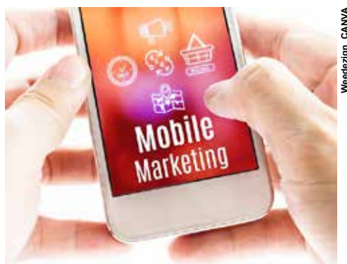
Os aparelhos eletrônicos se tornam o único meio de comunicação entre as empresas e seus consumidores. C

ele é um dos meios que possibilita o relacionamento mais próximo e interativo, com envio de mensagens praticamente instantâneo e, ainda, a possibilidade de ser personalizada e segmentada. Segundo o relatório do Simple Texting de 2020, quase 80% dos consumidores gostam de receber ofertas por texto, em conjunto com 53% que preferem se relacionar com marcas que utilizam SMS.