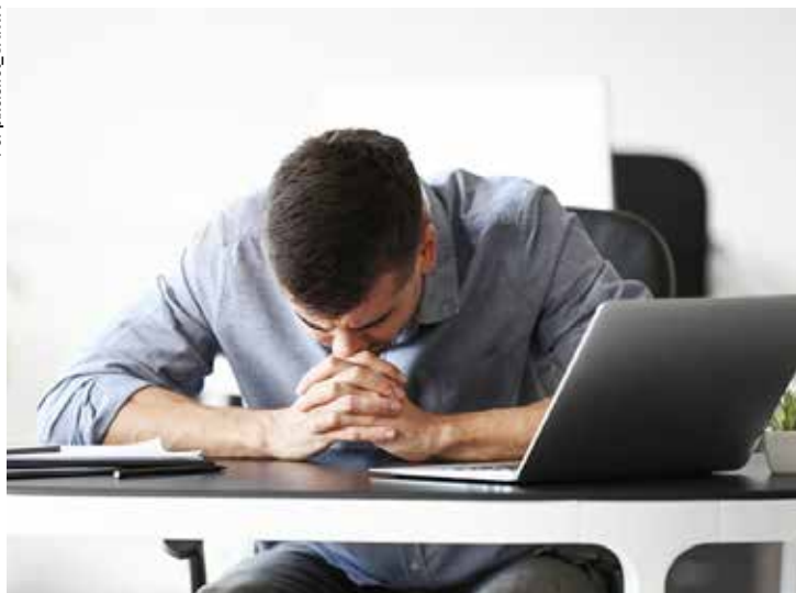
Por que essa falta de vontade para exercer tarefas que antes eram prazerosas?