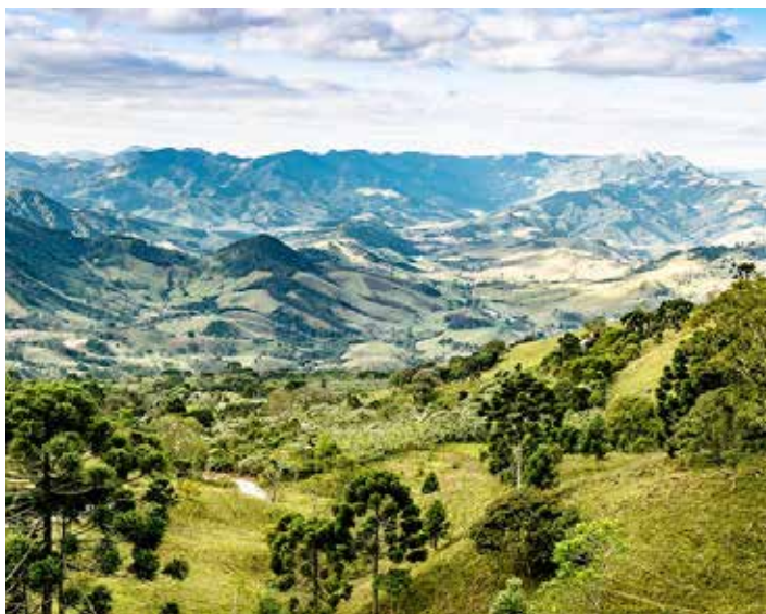
Ação vai restaurar um hectare de floresta, dentro de uma das maiores províncias de água mineral do mundo.

A restauração ecológica contribuirá para o desenvolvimento de cerca de 2.500 espécies de plantas nativas e permitirá a absorção de até 200 toneladas de CO2, além de auxiliar na recuperação de bacias