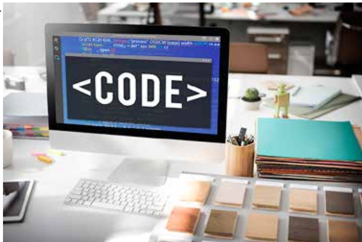
Levantamento da Salesforce identificou que 83% dos líderes de TI apostam em plataformas de pouco código.

Entre as vantagens mais valorizadas por CIOs estão a velocidade - o tempo de loop de clique, compilação e teste permite que usuários ágeis desenvolvam aplicativos em questão de minutos - e a estabilidade - ferramentas de baixo código amortizam os