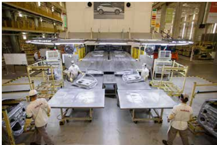
Os equipamentos dobram, prensam, furam, repuxam e cortam com precisão as chapas de aço que vão compor a estrutura do automóvel.

Gigantes e capazes de exercer uma força equivalente a até 190 toneladas de peso, elas compõem a área de estamparia da fábrica e são responsáveis por dar início ao processo de produção dos veículos brasileiros da Nissan. O Complexo Industrial da Nissan em Resende é um dos poucos no país a ter prensas como parte da sua estrutura interna, o que exige um alto investimento de implementação e operação, mas confere um alto nível de qualidade e agilidade no alinhamento com o processo industrial.