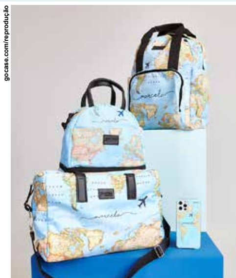
Cerca de 83% dos consumidores esperam que os produtos sejam personalizados e se adaptem às suas necessidades.

Os produtos - cases para celular, airpods case e capas para notebook, grips, carregadores de tomada e por indução, bolsas de viagem, mochilas, cadernos - em sua grande maioria são personalizáveis. O objetivo da marca