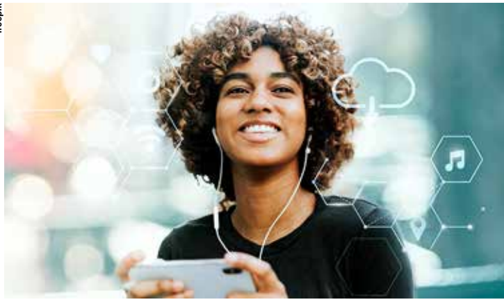
Embora o consumo de podcasts seja masculino, a participação das mulheres vem aumentando gradativamente.

Conforme divulgou a Associação Brasileira de