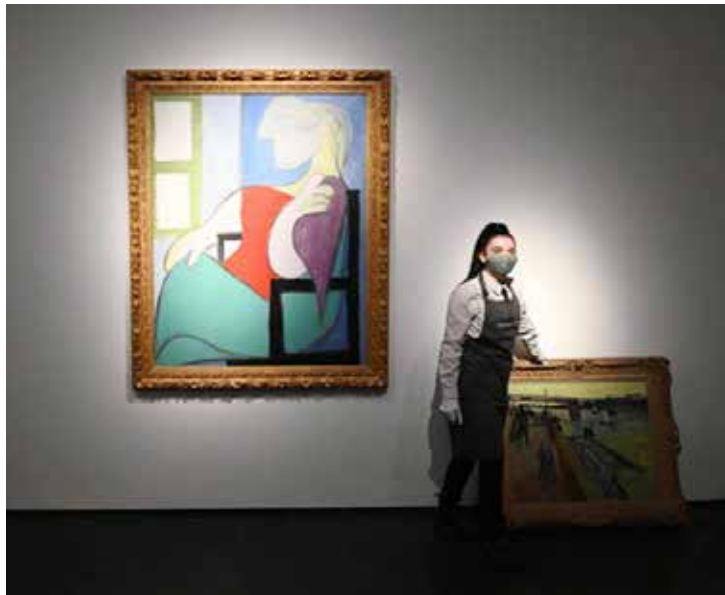
'Mulher sentada junto a uma janela' foi leiloadada pela Christie's.

A casa de leilões Christie's estimava vender o quadro de Picasso por cerca de US$ 55 milhões, mas o valor arrematado mostra que o mercado de arte não