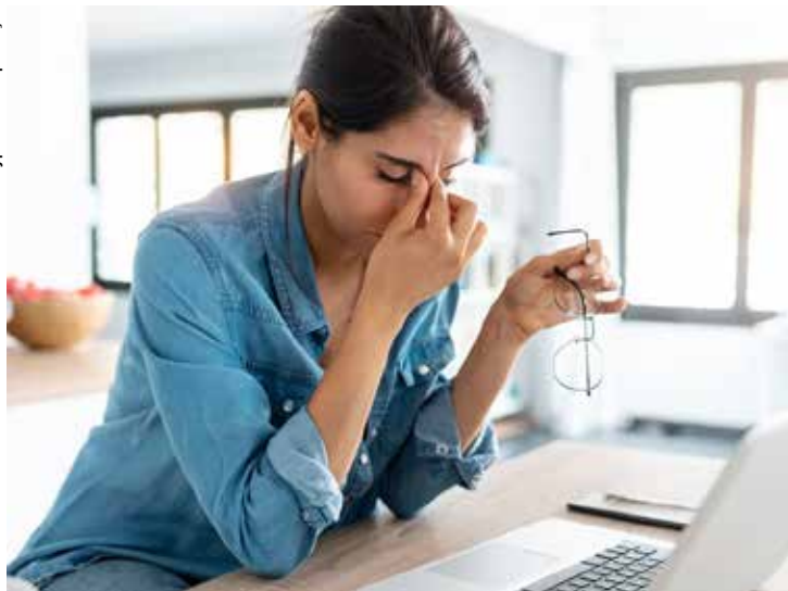
Uma pessoa pode não recuperar fotos ou documentos que não contavam com back-up ou armazenamento na nuvem.

Não se trata mais de 'se' os seus dados serão violados, mas de 'quando' isso vai