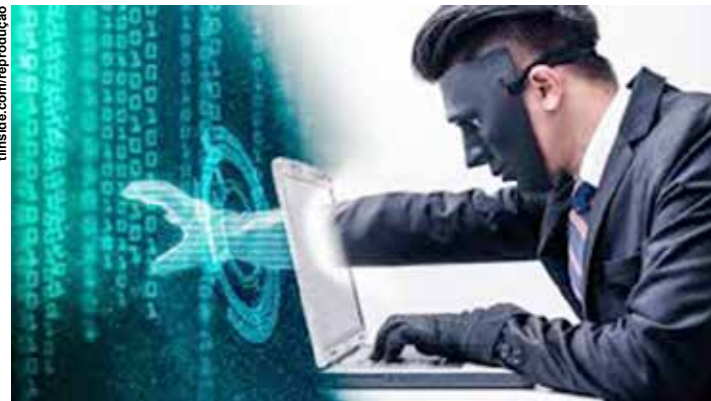
O risco cibernético se tornou um problema ainda mais relevante dado o momento em que estamos vivendo.

"Iniciativas amplas para conscientização da população sobre esse tipo de risco são fundamentais", complementa. Os países incluídos no ranking foram selecionados de acordo com a sua influência econômica, política, cultural