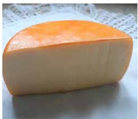
Queijo revestido com a zeína.