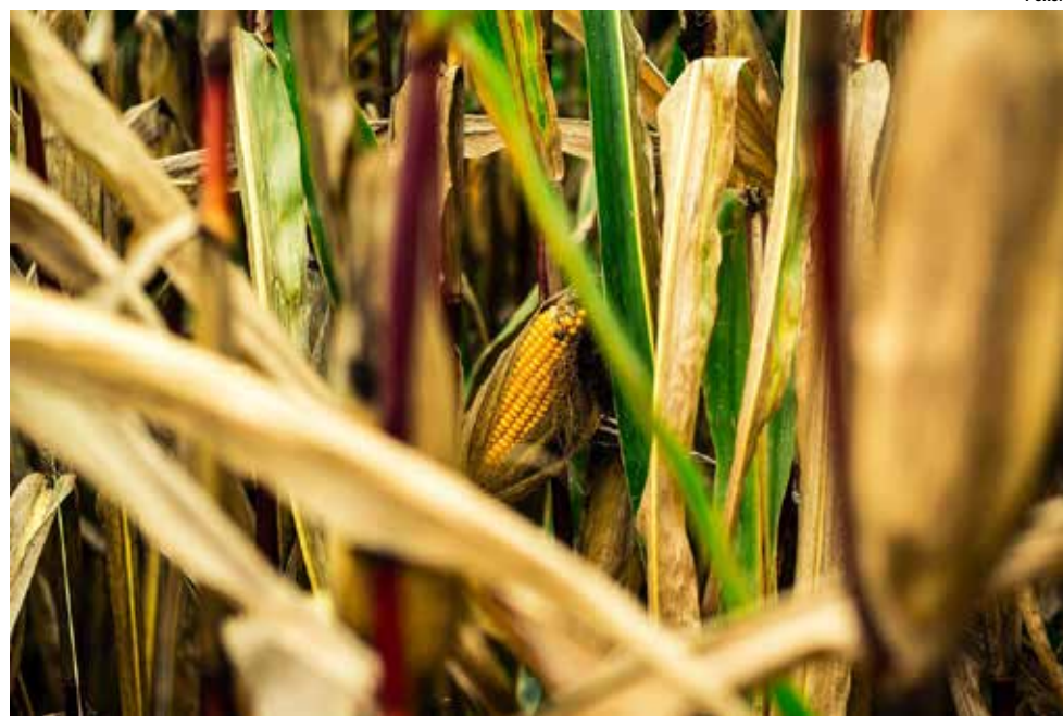
Novo método de extração da zeína (proteína do milho) a partir dos resíduos oriundos dos grãos do milho permitirá no Brasil a inserção de bioplásticos que utilizam o composto como matéria-prima.

Uma nova técnica de extração da zeína (proteína do milho) a partir dos resíduos oriundos dos grãos do milho permitirá no Brasil a inserção de bioplásticos que utilizam o composto como matéria-prima. Atualmente, os métodos utilizados no país para extrair a proteína dos resíduos não conseguem remover nem metade dela, o que desmotiva empresas a investir no seu uso. No entanto, com a nova estratégia proposta por um pesquisador do Instituto de Química de São Carlos (IQSC) da USP, a zeína poderá ser totalmente retirada, permitindo que usinas interessadas em extraí-la para venda ou indústrias que pensem em produzir bioplásticos sustentáveis e biodegradáveis possam obter um lucro de pelo menos 200%. Um pedido de "patente verde" da nova técnica já foi submetido ao Instituto Nacional da Propriedade Industrial (INPI).