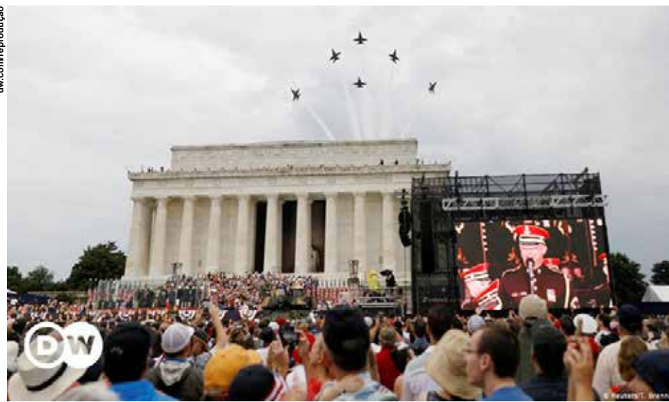
Os ciclos de expansão (Booms) e retração (busts) da economia são característicos dos sistemas capitalistas.

Os governos republicanos são marcados por grande volatilidade de ciclos econômicos. Os eventos que tiveram maior influência na expansão durante o período que o partido esteve no comando, foram impulsionados por eventos e políticas locais e globais como o fim da Guerra da Coreia, início da corrida espacial, Olimpíadas de Los Angeles e