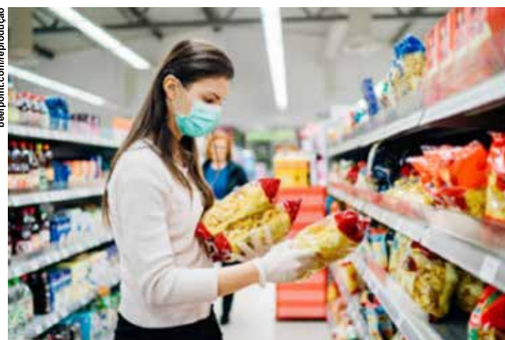
O hábito de consumir ou preparar refeições em casa continuará.

A maioria (67%) dos respondentes da pesquisa revelou que, mesmo após o fim das medidas restritivas, o hábito de consumir ou preparar refeições em casa continuará. Hoje, esse número é de 77%. A pesquisa também destacou a preferência pelo delivery e pela retirada em loja, com 33% dos respondentes afirmando que esta é a maneira pela qual estão recebendo os alimentos. Já 28% dos entrevistados apontaram que optam por retirar os alimentos em loja.