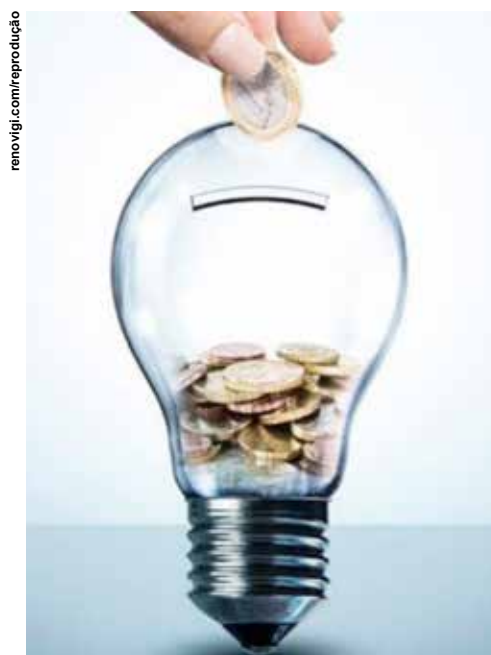
A energia solar é mais acessível ao pequeno produtor e representa uma economia significativa.

"Nossa conta de luz estava vindo muito alta, especialmente na época em que precisava irrigar a plantação.