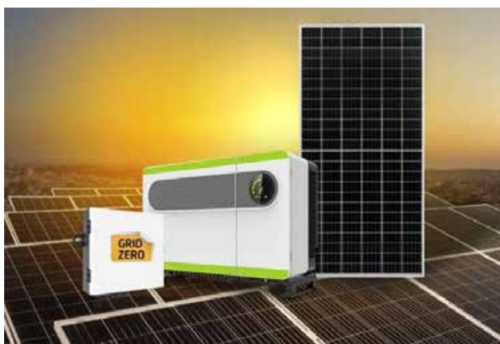
Gerador com várias tensões projetado para se conectar em paralelo à rede.

Além de garantir mais independência em relação à rede, eles também podem ser usados