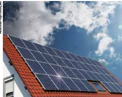
Fonte solar fotovoltaica, baseada na conversão direta da radiação solar em energia elétrica de forma renovável, limpa e sustentável.

A fonte solar fotovoltaica, baseada na conversão direta da radiação solar em energia elétrica de forma renovável, limpa e sustentável, lidera com folga o segmento de geração distribuída, com mais de 99,9% das instalações