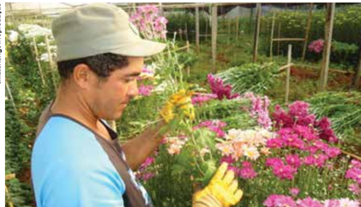
Pequenos empreendedores encontram uma nova forma de atuação em situações desafiadoras.

O cliente recebe mensagens automáticas de nosso sistema