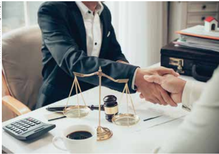
Os cuidados da administração e gestão são fundamentais para uma recuperação mais rápida.

Para isso, uma dica é que as empresas elaborem comitês especiais para a solução de problemas com