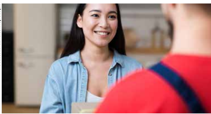
Maioria das empresas utilizam o delivery para incremento nas vendas.

Desde o advento da crise, 45% das empresas procuraram se adaptar à nova realidade e 69% afirmam que as ações tomadas serão permanentes no futuro. Entre as iniciativas implantadas diante do atual cenário incluem-se as vendas online e o deli-