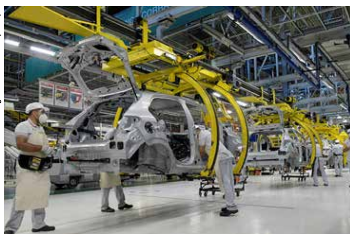
O destaque positivo ficou com o segmento veículos.

Na análise de 12 meses encerrados em junho, a